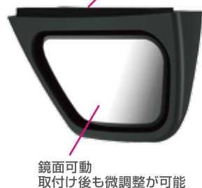
鏡面可動 取付け後も微調整が可能