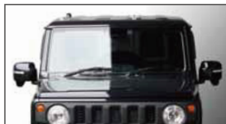
左右ドアミラーのバランスがとれてよりスタイリッシュに