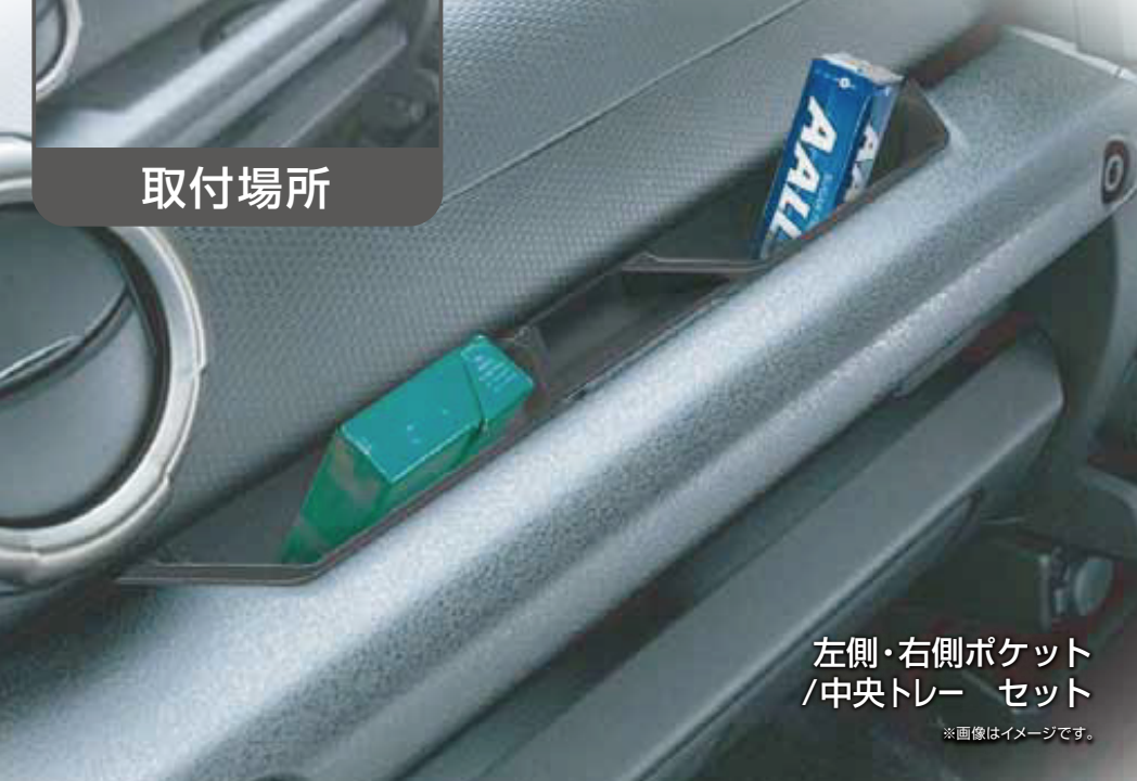
左側・右側ポケット /中央トレー セット